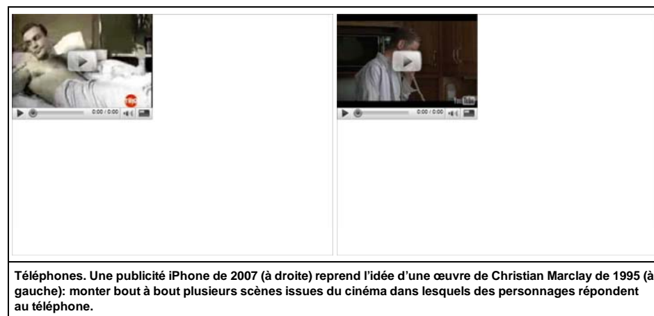
Téléphones. Une publicité iPhone de 2007 (à droite) reprend l'idée d'une œuvre de Christian Marclay de 1995 (à gauche): monter bout à bout plusieurs scènes issues du cinéma dans lesquels des personnages répondent au téléphone.

Un téléphone sonne. Gros plan en noir et blanc extrait du Crime était presque parfait d'Alfred Hitchcock. L'actrice Lucille Ball décroche: «Hello.» A l'autre bout du fil, Humphrey Bogart (Key Largo) répond: «Hello.» Suivent Marlon Brando, Jerry Lewis, Marilyn Monroe, Clark Gable, Peter Sellers et de nombreux autres acteurs mythiques, dans des scènes issues de films comme Un tramway nommé désir, Certains l'aiment chaud ou encore La panthère rose. A chaque fois, c'est le même geste. La main s'empare du combiné, le porte à l'oreille et la bouche articule un «Hello» de circonstance.